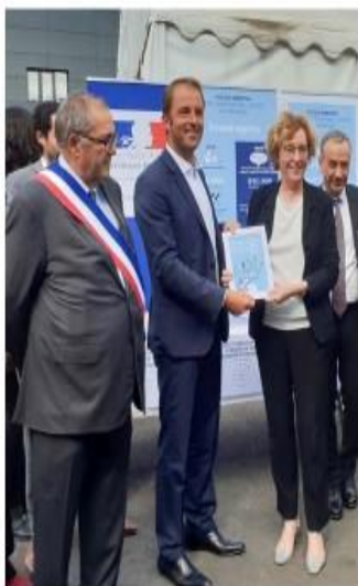
Remise du Pacte d'ambition pour l'IAE par Thibaut Guilluy à la Ministre du travail, Muriel Pénicaud